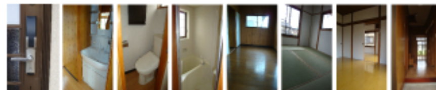
デジタルキー 洗面化粧台 ウォッシュレット 浴室 2F洋室 2F和室 1F洋室 玄関ホール