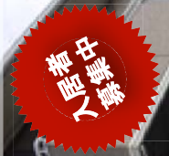
ブリリアント開成Ⅱ 外観