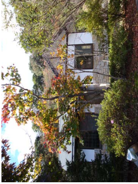
付属建物 居宅 木造亜鉛メッキ銅板葺平屋建 37.36 m 2 (11.30坪) 平成15年5月25日新築 (アトリエ・飲食店舗(カフェ)利用可能)