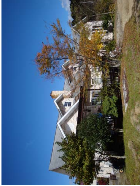
全築 居宅 木造スレート葺平屋建 200.93 m 2 (60.78坪) 平成12年5月1日新築